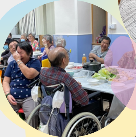
歡樂團圓慶中秋晚宴