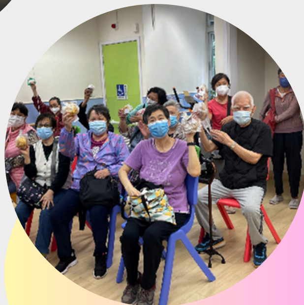
膳心連食物轉贈 合作計劃